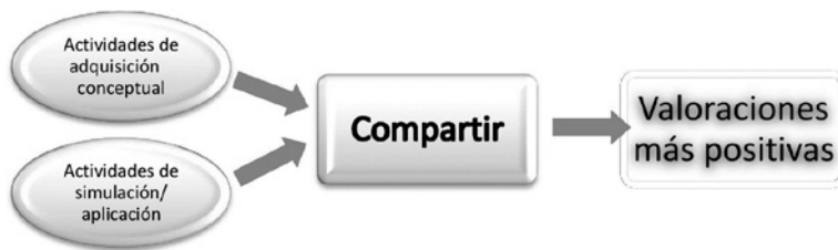
Figura 2. Esquema relacional de los núcleos representacionales de la utilidad de las actividades de aprendizaje (elaboración propia).